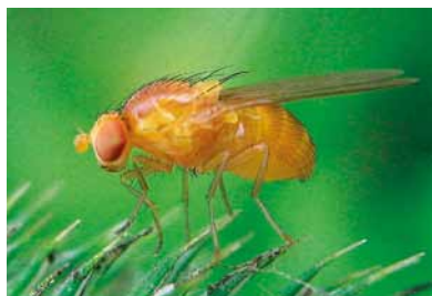
octomilka 140 Mb