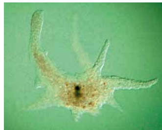
Amoeba dubia 670 Gb

Velikosti genomů u vybraných druhů dokládají, že neexistuje korelace mezi velikostí genomu a složitostí organismu. Gb = gigabáze = 10^9 párů bází, Mb = megabáze = 10^6 párů bází