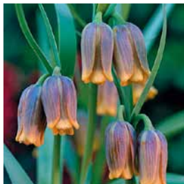
Fritillaria assyriaca 130 Gb